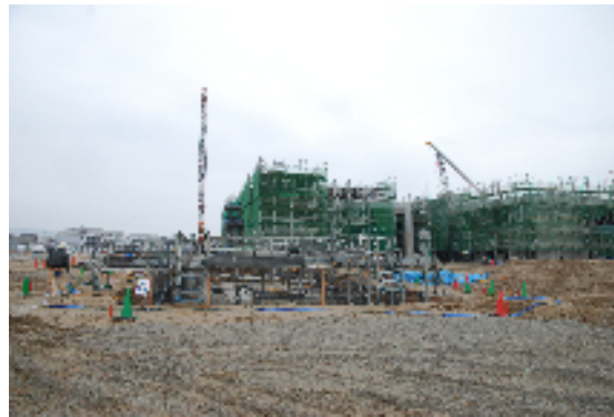
園芸倉庫の基礎工事（南側から）