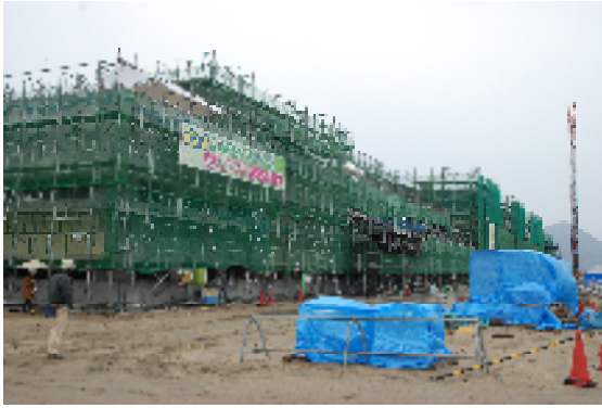
北西から見た校舎全景