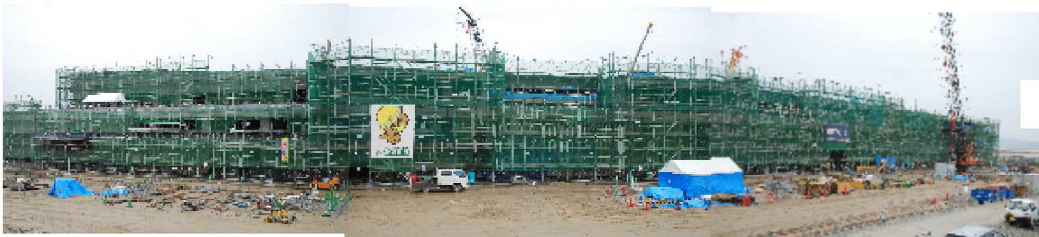
西側からの校舎全景

コンクリートを流し込む作業が終わり一部内装工事に入っています 平成24年 3月4日現在