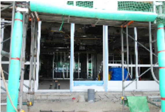
窓枠が付けられた教室