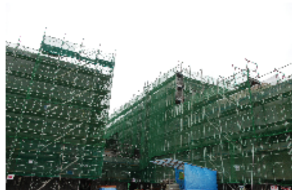
体育館（左）と屋内プール（右） 3階は支援センター

コンクリートを流し込む作業が終わり一部内装工事に入っています 平成24年 3月4日現在