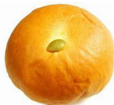
北海道カボチャ クリームパン