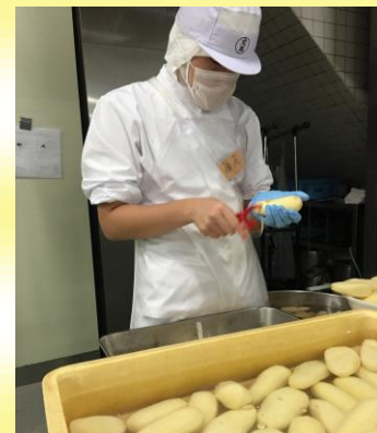
(弁当製造会社にて)