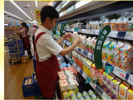
(スーパーマーケットにて)

インターンシップは、企業等において職場実習を体験することにより、職場の基本的なルールや適切な対人態度、作業遂行力や労働習慣に関する知識や能力を身に付け、働くことの面白さ、充実感、大切さを学びます。