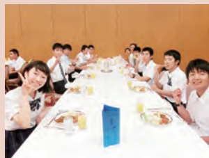
ホテルでの食事 (高1)

家庭を離れていつもとは違う環境の中で、友達と共に宿泊をする体験を通して集団生活のあり方について学びます。 小学部4年、中学部1年は、校内の生活指導室を中心に宿泊をします。高等部1年生については、市内の宿泊施設を利用します。