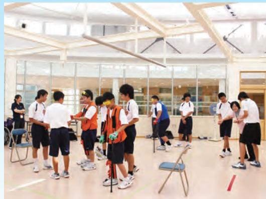
介護の基礎技術を社会人講師から学ぶ