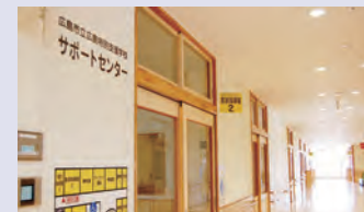
サポートセンター

本校では、広島市立の幼稚園、小学校、中学校、高等学校に在籍している幼児児童生徒やその保護者及び学校の関係者を対象に教育相談を行っています。