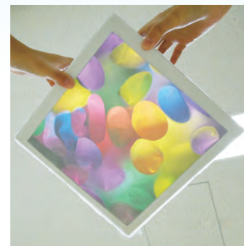
きらきらボックス