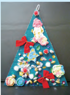
クリスマスツリー