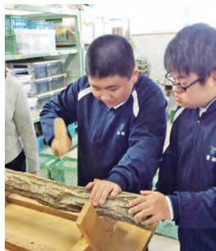
しいたけの菌打ち