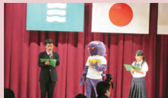
きょうりゅうくんの登場（高等部生徒会）