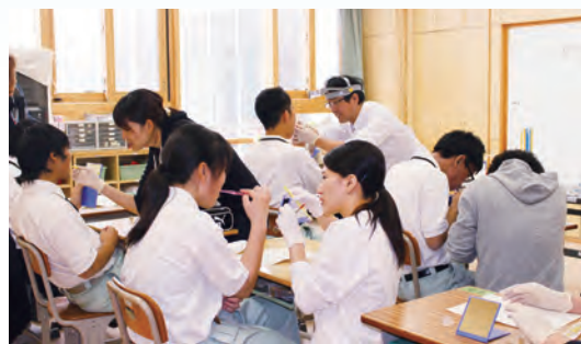
学校医とスタッフによる歯科指導