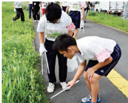
出島クリーン作戦