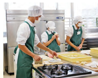
【作業学習】 フードサービス