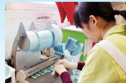
歯科器具の袋閉じ

こうとうぶ ころ こうないじっしゅう こう しよくば たいけん じっしゅう 高等部では、高1で校内実習、高2で職場体験実習、 こう しよくば じっしゅう おこな 高3で職場実習を行います。