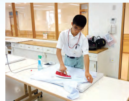
【作業学習】 クリーニングサービス