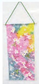
染めタペストリー