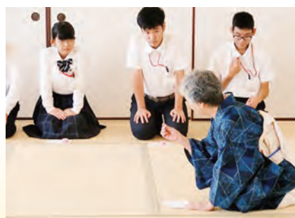
【総合的な学習の時間】 茶道の体験