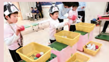
なげっこランド（小6）