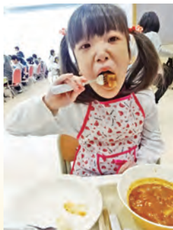
おいしくいただきます