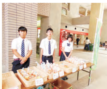
校外でのパンの販売