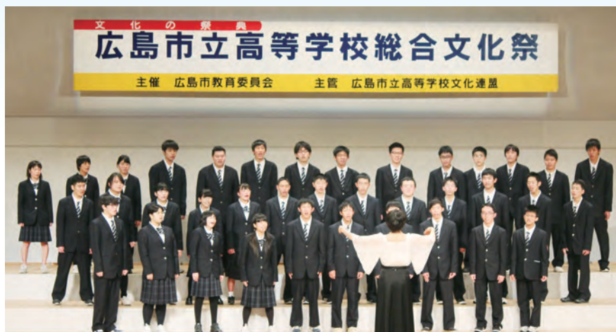
広島市立高等学校総合文化祭（ステージ発表）