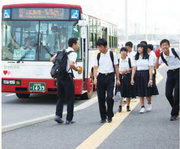
バス(公共交通機関)での通学