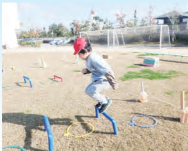
ミニハードルをジャンプ