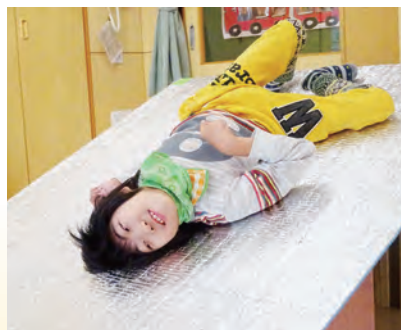
「体育」ジャンボ滑り台