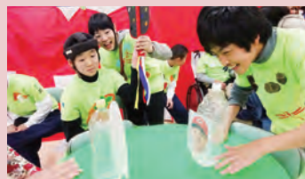
トントンずもう（中1）