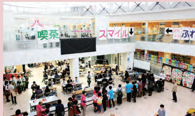
喫茶スマイル（高等部職業コース）

がつ ぜんこう おこな 11月に全校で行います。ステージあり、作品 てんじ さいし 展示ありで、毎年たくさんの方が来てくださるに ぎやかな行事です。児童生徒も張り切って、準 び 練習に取り組みます。