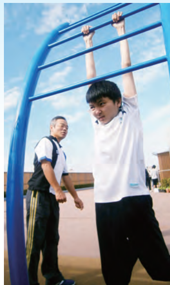
屋上で体力づくり