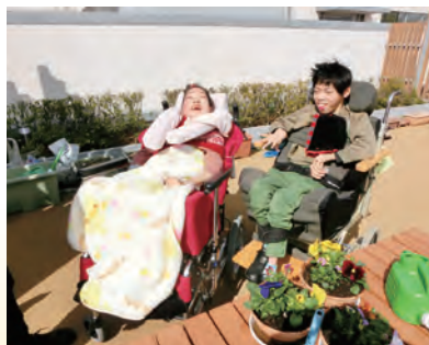
【生活単元学習】季節の花