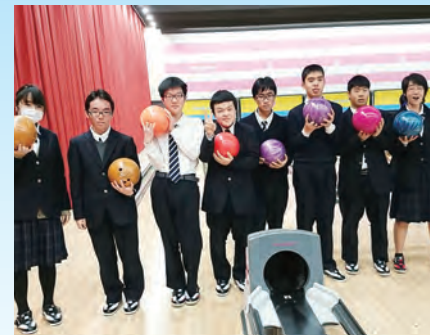
【特別活動】 校外学習