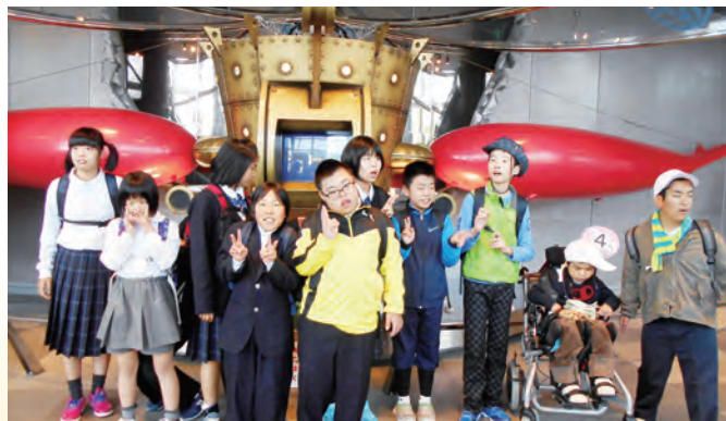
【生活単元学習】マジ交通ミュージアム