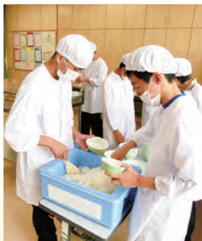
同じ分量で配膳します