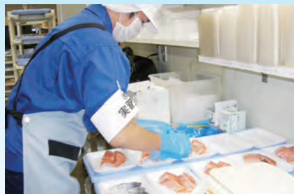
鮮魚のパック詰め