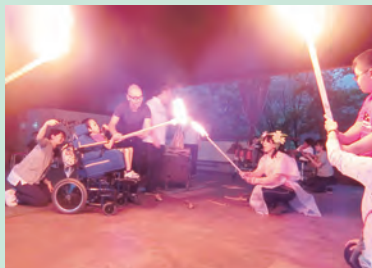
キャンプファイヤー (小5)