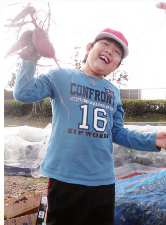
「生活単元学習」大きなさつまいもができたよ