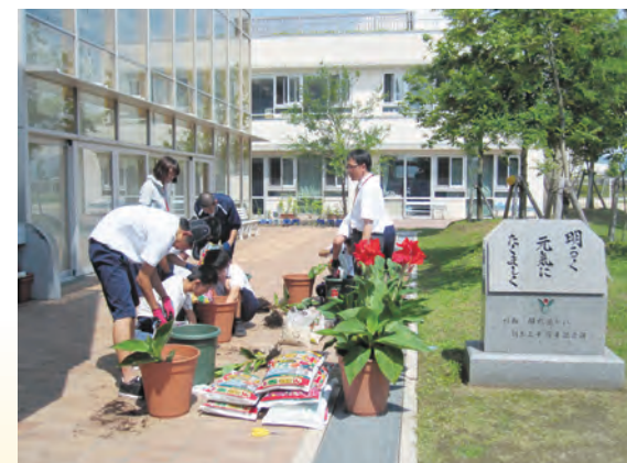
「平和の花カンナ」の植え替え