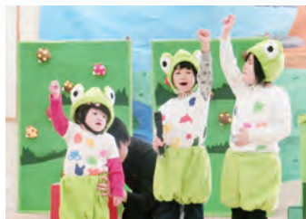
「生活単元学習」発表会