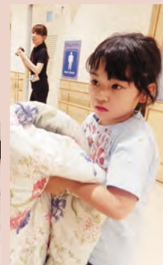
自分のことは自分で (小4)