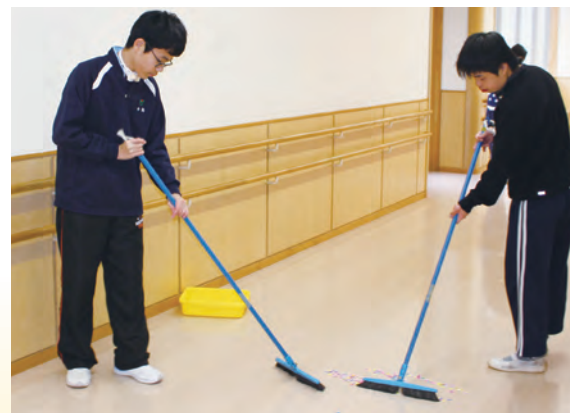
【総合的な学習の時間】ボランティア掃除