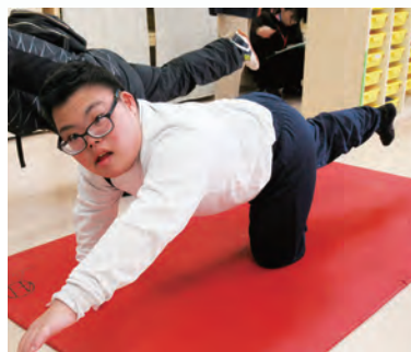
体幹トレーニング