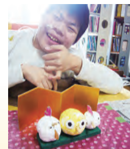
【自立活動】干支の飾り作り