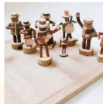
小枝を使った製品