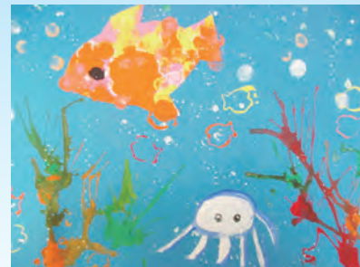
Tシャツのデザイン画