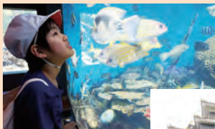
渋川マリン水族館 (小6)

小学部6年、中学部3年、高等部2年で行います。 見聞を広め、自然や文化などに親しむとともに集団生活を体験し、公衆道徳についても学びます。