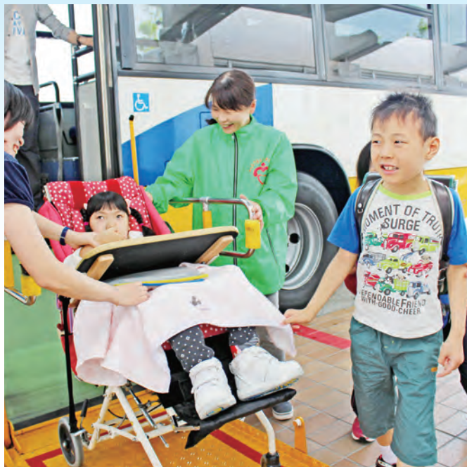
スクールバスでの登校

こうとうぶ せいとお なか こうりょうこうつうきかん りょう つうがく せいとお 高等部の生徒の中には公共交通機関を利用して通学している生徒もいます。