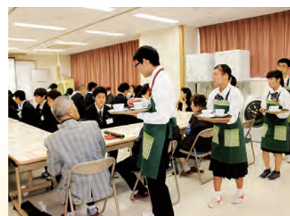
地域の方々との交流会