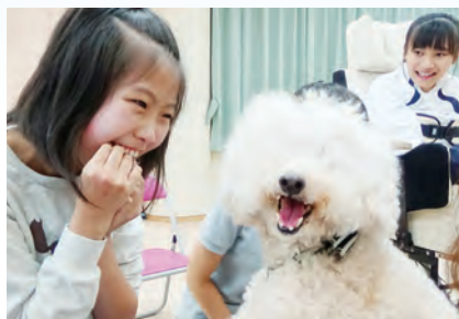
【総合的な学習の時間】犬とのふれあい