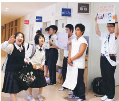
生徒会のあいさつ運動