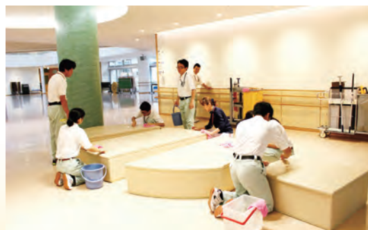
「校内をきれいにします」ビルメンテナンスサービス班