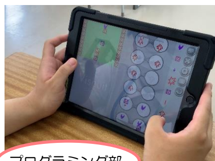
プログラミング部

6月から今年度もサークル活動が始まりました。月に1回程度、3学年合同の縦割りグループで活動します。今年度のサークル紹介プレゼンは2・3年生生徒が担当しました。プレゼンはZOOMで中継し、緊張しながらもサークルの魅力を楽しく伝える2・3年生の姿がありました。昨年度からのスポーツ部、プログラミング部、ウォーキング部、写真部、ボードゲーム部に加え、美術部も創設され、1年生が心待ちにしていた第1回サークル活動は6月14日(水)に行われました。