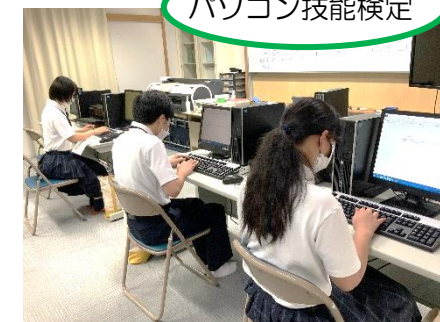
パソコン技能検定