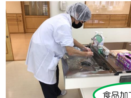
食品加工技能検定