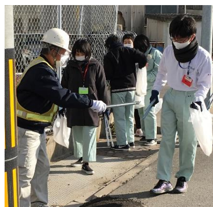
出島管理事務所の方と協力してごみを拾いました。