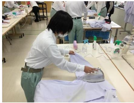
○クリーニングサービス