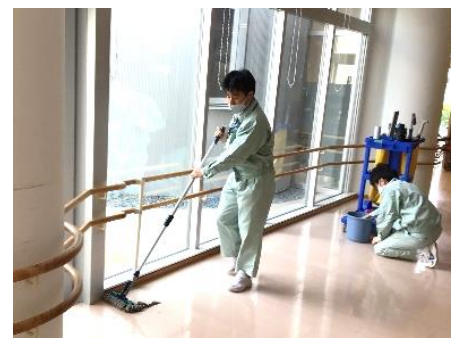
○ビルメンテナンスサービス

○ 第1学年は3種目のトライアルをして経験を広げ、第2学年は3種目のうちの2種目を経験して基礎的な力を高めます。第3学年は1年間同じ種目で応用力を高めます。