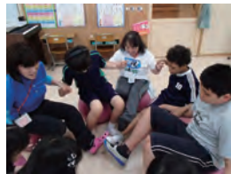
だれが一番に 転んじゃうのしょう