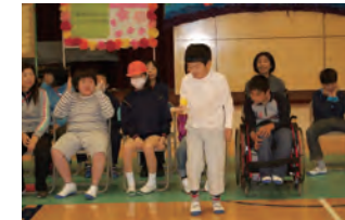
けん玉、披露します