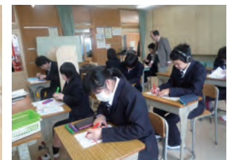
真剣に勉強しています