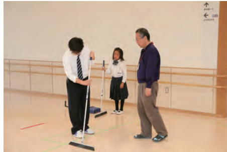
きっちりお掃除、細かいほこりも逃しません