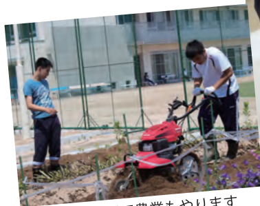
作業学習で農業もやります