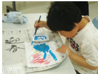
ぼく、真剣に描いてます！