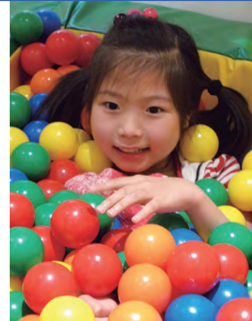
ボールプールでリラックス