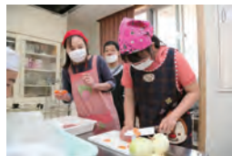
うまく切れてるでしょ