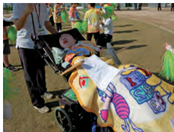
小学部の運動会に参加したよ