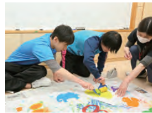
協力して作ります