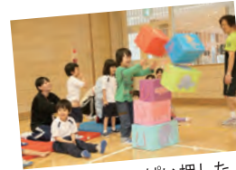
せいの、カいっぱい押したよ