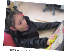
顔にも描いちゃった