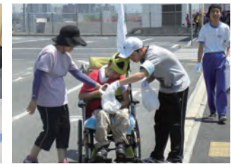
出島クリーン作戦に参加しました