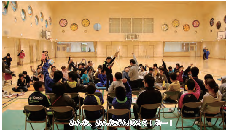
みんな、みんながんばろう！おー！