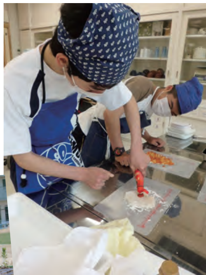
特製ピザができますよ