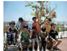
見て、見て、 素敵なバッグができました！