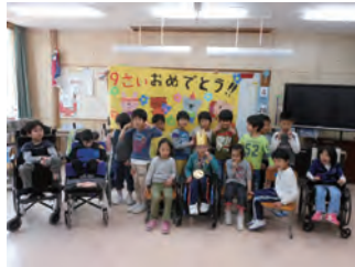
大きくなったね 誕生日会