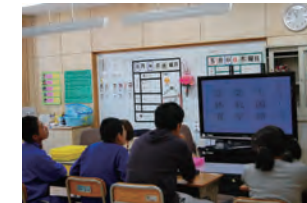
よく見て考えよう