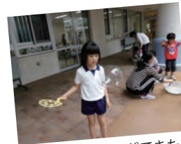
大きなシャボン玉ができたよ