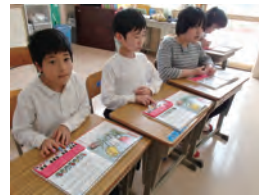
けんハモのレッスン ドレミファソ