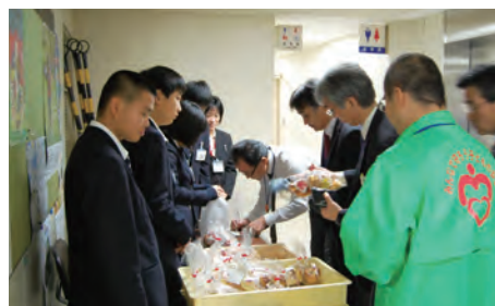
自信のパンやケーキを売ってみました