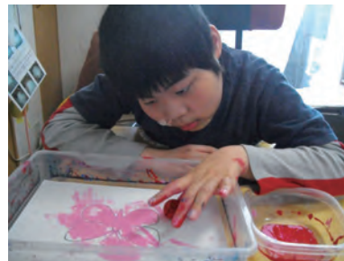
フィンガーペインティングだよ