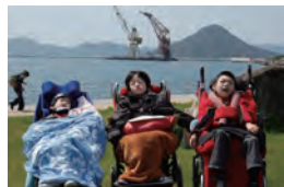
宇品公園へ行ってきました！