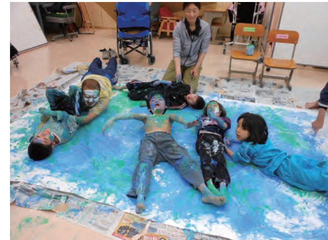
全身で描いてみました