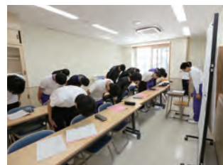
挨拶の仕方が板に付いてきました