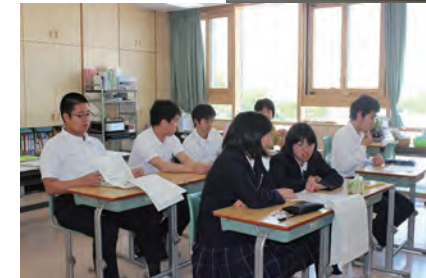
協力して 学びます