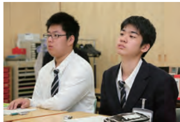
仲間と学ぶと楽しいね