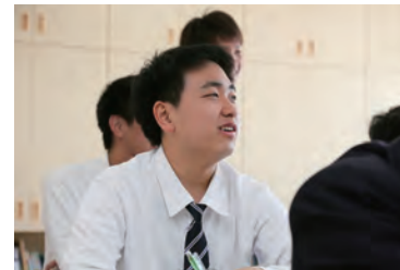
一生懸命学ぶ姿は輝いています