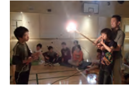
もうすぐ野活、ファイヤー練習、うまくつかから？