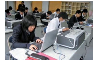
ワープロの技能検定にも挑戦します

◆社会人としての職業スキルや知識、社会性を伸長し、自立した地域生活を目指します。