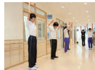
業間体操は大切です