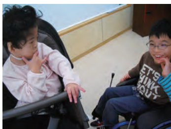
スクーリングは楽しいよ！