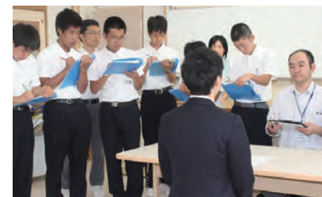
就労支援アドバイザーの方を招いて面接の方法についても学びます