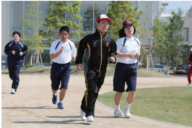
朝、しっかり走って体力づくりをします