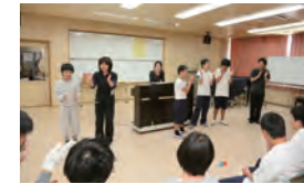
さあ、歌いましょう