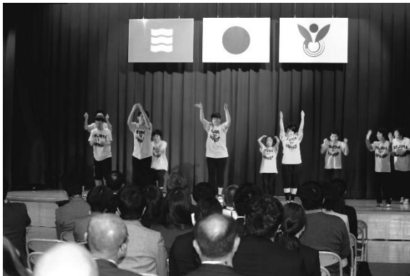
全国学校体育研究大会広島大会でステージ発表

昨年度は、練習の成果を発表するステージが2回ありました。1回目は、11月13日第54回全国学校体育研究大会広島大会第12分科会、広島市立広島特別支援学校体育館ステージにおいて、アトラクションとして招待され発表しました。初めての発表会で緊張していましたが、ミュージックが流れ始めるといつものとおり体が動いていました。何とか1曲マスターし、カー杯発表できました。大きな拍手に感動！