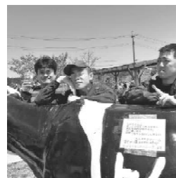
トムミルクファームにて

学校卒業後や、その他環境の大きな変化の中でも、共に歩んできた仲間と、安心して活動が出来る大切な居場所になっています。(●ω●)