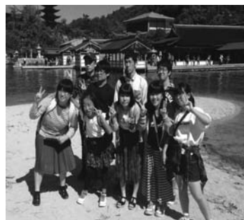
昨年 10 月の宮島遠足