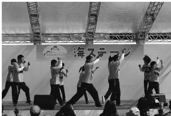
「広島みなとフェスタ」でステージ発表

第2回目は、平成28年3月12日土曜日、宇品港前の港公園で行われた「広島みなとフェスタ」のステージに立ちました。この日のために1曲増やし、2曲発表しました。もちろん野外でのステージは初めてです。生徒のチームワークがすごく良くて最高の舞台となりました。ダンスを通して仲間と出会い、心身が健康になり、自信が持てるようになってきた姿を見ることができました。