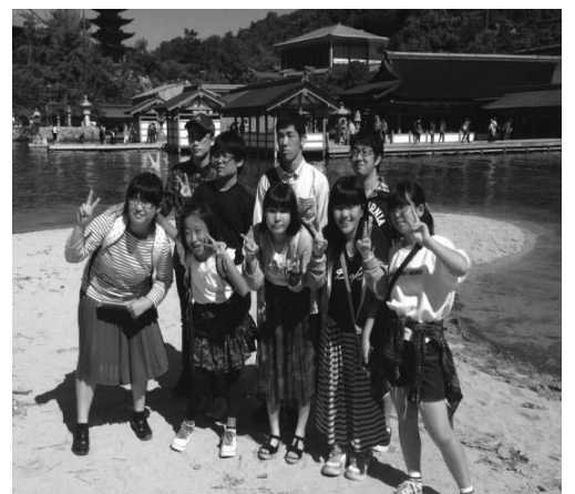
昨年 10 月の宮島遠足

なんだか色々大変そう…と思っていた地域活動推進事業のグループ活動でしたが、思いきって飛び込んでみたら、(一番大変そうと思っていた) 事務的なことは事務局の先生が丁寧に教えて下さいますし、他のグループの方と情報交換もでき、何より「DEJIMA」の活動日を楽しみにし、楽しんでいる子どもや保護者がいること…いい事ばかりでした! ←少し大袈裟に言ってます(^^)。今後は諸先輩方の老舗? グループの活動も参考にさせていただきながら、私達らしいグループにしていきたいなあ…と思っています。