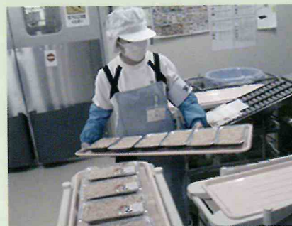
(販売業:バックヤード)

インターンシップは、企業等において職場実習を体験することにより、職場の基本的なルールや適切な対人態度、作業遂行力、労働習慣に関する知識や能力を身に付け、働くことの面白さ・充実感・大切さ等を学びます。