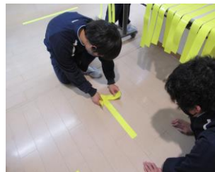
まっすぐに貼ります