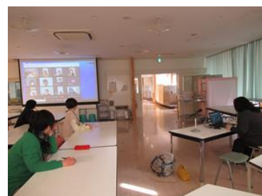
第7回PTA 運営委員会の様子

令和4年3月7日(月)に本年度最後の保護者説明会を実施します。多くの方の御参加をお待ちしております。