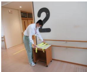
作業の準備中です

現在、本校舎の廊下中央にラインテープを順次貼っています。これまでは通行ルールがなく、進行方向の違う人同士でぶつかったり、横一列に3人以上が手をつなぎ連なって歩いたりする状況があったため、通行区分を明示して、廊下での衝突や密を避けることが目的です。また、教職員と児童生徒、あるいは児童生徒同士が、手を繋ぐなくても一人で移動できるようにすることも目的としています。安全に留意しつつ、一人一人の自立に向けた取組を進めています。ライン貼りは、高等部第1学年普通科校内美化グループ、高等部第1学年職業コースの生徒が作業学習の時間を実施しています。学校からの発注を受け、テープを均一に切ったり、メジャーで貼る位置を確認したりして作業を進めています。範囲が本校舎全体に及びますのでかなりの距離になりますが、グループごとに協力して作業を進める姿に大きな成長を感じます。右側通行を基本としていますので、来校された際には御協力ください。