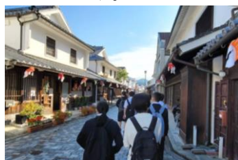
歴史ある景観でタイムスリップ!