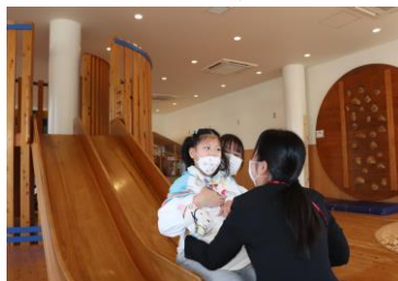
ポムポムでは、木の滑り台やアクアロールなどの遊具が魅力的でした。