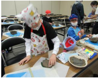
貝殻やひもで、土器に飾りをつけました。