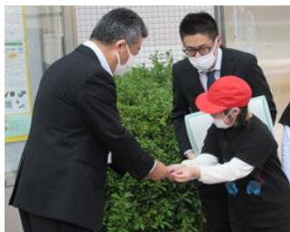
お世話になったお礼に、手作りのキーホルダーをプレゼントしました。

第1日は、秋晴れの下、広島特別支援学校を元気にバスで出発しました。「ヌマジ交通ミュージアム」では、いろいろな形の「おもしろ自転車」に乗り、「みよし風土記の丘」では土器づくりを楽しみました。宿泊した「かんぼの郷庄原」では、美味しい食事といろいろなお風呂に大満足でした。第2日は「府中市こどもの国ポムポム」で、工作をしたりアスレチックで遊んだりしました。この2日間、児童たちは、活動を楽しむだけでなく、各自の役割にも意欲を持って取り組みました。教師が示す活動の流れをよく見て、自信をもって司会をしたり挨拶をしたりすることができました。また、食事で給仕をしてくださる方に「ごはんのおかわりください。」と伝えたり、お辞儀をして「ありがとうございます。」とお礼を言ったりするなど、マナーにも気を付けて過ごす姿に、成長を感じました。