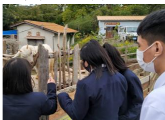
動物たちに癒されました。