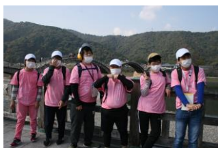
錦帯橋ポーズ決まったね!

小春日和の第1日は、バスで錦帯橋に向かいました。橋を渡ったり、紅葉や岩国城などの風景をゆっくりと眺めたりしました。川面に映る紅葉はとても綺麗で、記念写真をたくさん撮りました。移動中のバスの中では、事前学習で学んだ「山口県クイズ」で盛り上がりました。事前に調べた内容を確認するのもとても大事な学習で、山口銘菓外郎を販売している田原屋では、外郎工場を見学し、材料に触らせてもらったり甘い匂いを嗅がせてもらったりしました。湯田温泉では、土産を買ったり温泉街を散策したりしました。宿泊した「西の雅 常盤」では、美味しい料理と温泉を楽しみ、そして、「女将劇場」の鑑賞では、いろいろな出し物に興味津々でした。第2日は、サファリパークに行きました。バスの傍まで寄ってくる、象やキリン、熊やホワイトライオンは迫力満点でした。