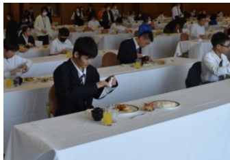
豪華な料理に大満足!!