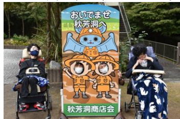
秋芳洞に来た記念、顔はめパネル前で

第2日、職業コース、I・II・III類の生徒は、柳井白壁の街並みを散策しました。江戸時代から明治にかけて建てられた建築群は、昔にタイムスリップしたかのような感覚になり、それぞれが思い思いに街を歩き楽しみました。最後に、広島グランドプリンスホテルでのランチを堪能しました。広い会場とおいしい料理に笑顔いっぱいでした。この2日間は、生徒にとって貴重な経験と思い出になったことと思います。