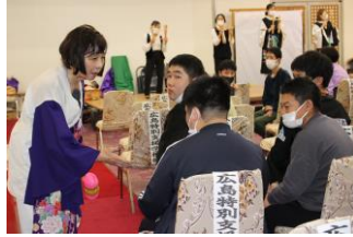
おかみさんのツッコミにタジタジ!