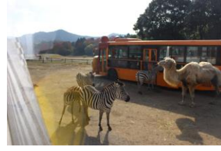
大迫力! サファリパーク!