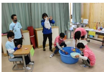
みんなに楽しんでもらうために、いろいろ準備しました。