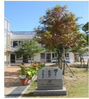
木々の葉が秋らしく色づいてきました。

ホームページ : http://www.hiroshimayogo.edu.city.hiroshima.jp/