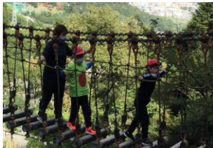
つり橋もみんなで渡れば怖くない

本年度は新型コロナウイルス感染症の影響で実施が危ぶまれていましたが、同施設の御厚意により、小学部第5学年程度の少人数であれば、休館日に受入れが可能との打診があり、本校のみの貸切使用が今回実現したものです。感染症対策のため、全学級一斉の活動は避け、グループや学級ごとに分かれての内容へ変更となりましたが、友達と協力しながらそれぞれの活動に取り組み、やり抜くことをとおして、学級の絆がより深まりました。