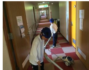
退所前に皆で掃除を頑張りました。