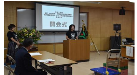
開・閉会式はリアルタイムで各学校に届けました。