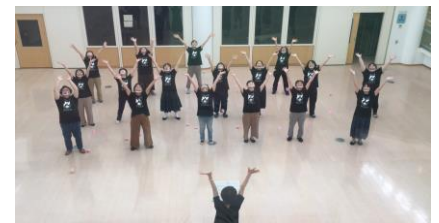
素晴らしい歌声のPTAコーラス