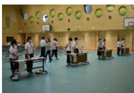
受付で高等部の生徒が爽やかにお出迎えました。