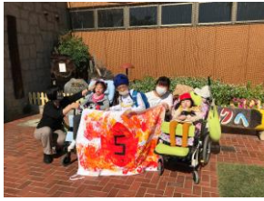
三滝少年自然の家の玄関で記念撮影

小学部第5学年が10月12日（月）、13日（火）、西区の三滝少年自然の家へ野外活動に行きました。登校後各学級で行った「始めの会」では、校長先生からビデオで励ましの言葉をいただきました。事前学習から期待感一杯の児童は、いよいよ本番を迎えやる気満々です。三滝少年自然の家へ到着したら2グループに分かれて入所式を行いました。