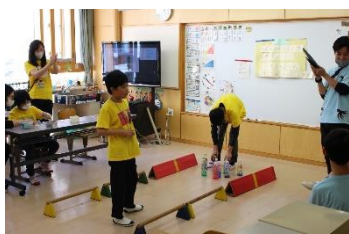
係ごとに分担を決め、当日はその任務を果たしました。