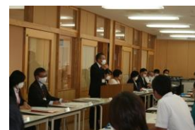
高等部学校説明会では、中学校の先生方が熱心にメモを取られていました。

9月30日(水)に高等部普通科オープンスクールを開催し、中学校第3学年の生徒51名とその保護者、中学校の先生方が参加されました。本年度は体育館での説明のみでしたが、高等部の生徒が、玄関や受付で皆様をお出迎えました。高等部の生徒が自信をもって対応する姿は頼もしく、本校での生活にもイメージをもっていただけたことと思います。