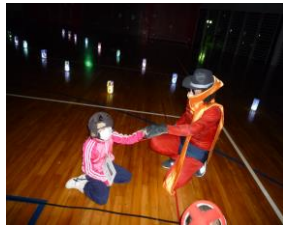
夜の体育館で神様！？に遭遇