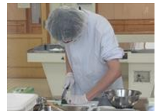
キュウリの薄切りに挑戦中

また、17日(土)には、広島大学で第2回広島県特別支援学校接客技能検定が行われ、本校からは、28名の生徒が受検をしました。今後も、様々な場での経験をもとに生徒が成長していけるよう、指導・支援をしていきたいと思っています。