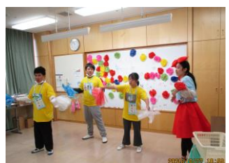
教室にステージをつくり、「パブリカ」を踊りました。