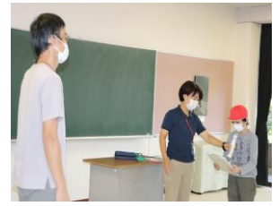
退所式で職員の方にお礼の気持ちを伝えました。