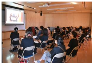
PTA役員の皆さんも別室でリモート参加しました。