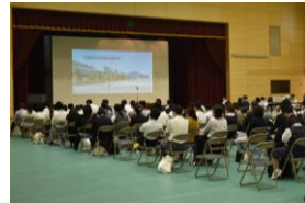
体育館ではパワーポイントやビデオで説明しました。

10月23日(金)には、高等部学校説明会が行われ、30校31名の中学校の先生方が参加されました。本校の教育目標や高等部の教育内容、スクールバスや諸経費、高等部入学までの日程について御説明いたしました。生徒や保護者、先生方それぞれの立場で本校の教育を知っていただき、是非、たくさんの中学生在受検されることを期待しています。