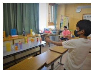
的当ても、学級ごとに様々な工夫が見られました。