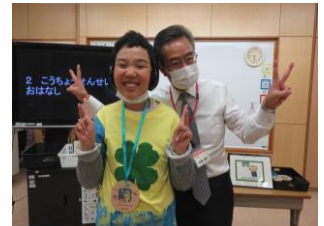
一人一人、校長先生にメダルを掛けてもらいウキウキです。