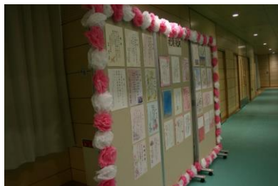
来賓の皆様からの温かい祝詞

4月9日(木)に高等部入学式を挙行いたしました。今年の入学式は新型コロナウイルス感染症拡大防止のため、御来賓の皆様の御臨席はいただけませんでしたが、本年度、99名の新入生を迎えました。新入生の皆さん、入学おめでとうございます。式辞の中で、学ぶことの実践についてお話をしました。教科の学習についてはもちろんですが、働くということに必要なこと、基本的な生活習慣を確立するために必要なこと、生活を豊かにするために心と体の調子を整えるために必要なことを学ぶ本校の様々な授業、そしてその授業での学習の成果を活かす様々な行事の大切さを理解してもらえたことと思います。知識を行動で活かすことで、学びを深めていきましょう。