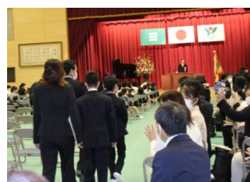
堂々とした入場の様子

新型コロナウイルスの拡大防止措置がとられる中、御出席いただいたPTA会長、副会長の皆様にお礼を申し上げます。