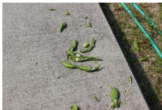
野鳥？に食べられてしまいました！

新型コロナウイルスで世界中で不安に感じている人々が多い中、本校の農園では、生徒の皆さんと先生方の御尽力により、春の暖かい日差しをいっぱい受け農園の野菜がすくすくと成長しています。