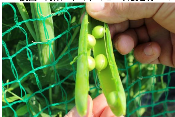
穫れたてのグリーンピース！