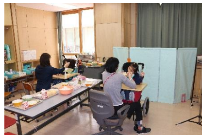
教室での給食風景