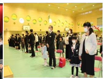
しっかり胸をはりました。