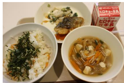
久しぶりの給食メニュー

授業においても、3密を避けることを徹底し、ソーシャルディスタンスはもちろん、マスクの着用を励行し、手洗いについては頻度を上げて行いました。また特別教室内での人数も限定し、体育館においても調整を図って制限人数以下での実施を行い、授業内での活動についても十分な配慮を行って実施しました。残念ながら4月16日から再度臨時休校措置がとられ、再び児童生徒の皆さんと会えない状況になりましたが、本校として児童生徒・保護者の皆様へサポートをどのように実現していくかを現在学校を挙げて検討しています。いつでも児童生徒の皆さんを迎え入れることができるように、日々教室の整備も進め、今後の対応方法についても協議を重ねております。今、学校としてできることは何かを私たちは真剣に考えて、今後も対応してまいります。児童生徒及び保護者の皆様におかれましても、この非常事態宣言が出された状況を御賢察の上、事情を御理解くださいますようお願い申し上げます。