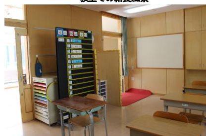
再開の日を待つ教室