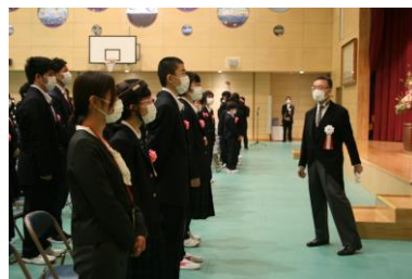
一緒になって校歌を歌いました。

本校の目指す子ども像は、「あかるく 元気に たくましく」です。この目標を胸に、一日一日を一生懸命生きて、これから始まる学校生活を一步步ずつ前進して行きましょう。皆さん一人一人が輝く未来に向かって、家でも学校でも、自信と誇りをもって輝くような毎日を過ごしてほしいと思います。本校教職員は、児童生徒一人一人に応じたきめ細やかな指導と全力支援を一丸となって行い、児童生徒がきらめくような人生を歩んでいくことができるよう努めていきます。