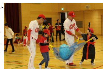
運動会の種目「荷物運び」はカーブの選手をリードして!?