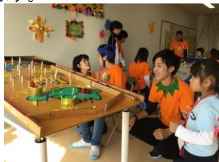
ゲームコーナー(中学部第1学年)