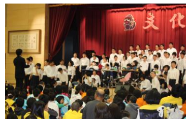
響き渡る合唱(高等部第3学年)