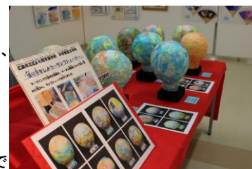
中学部生徒の作品

なお、本年度も広島市立広島商業高等学校ピースデパートに本校高等部も参加し、12月2日(土)、3日(日)の2日間、作業学習で製作した製品を販売します。こちらにも是非、足を運んでいただけたらと思います。