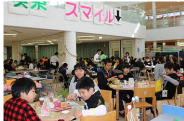
喫茶スマイル(職業コース第2・3学年)