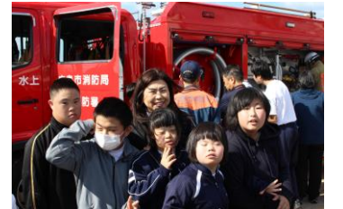
放水後、消防車をバックに記念撮影