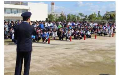
避難後、講評を静かに聞く児童生徒

児童生徒は、この「大切な命を守るための学習」に真剣に取り組み、全員が整然と隊列を作って迅速に避難することができていました。実施後の会議では、本部と避難場所の情報共有や教職員を含めた避難後の安全確認をどう効率よく行うか等の課題を整理しました。児童生徒がより安全に避難できるよう更なる改善を図っていきます。