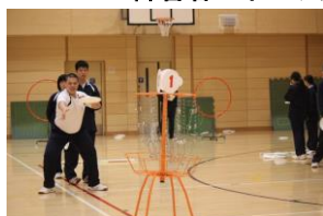
構えも上達! フライングディスク

今後も様々な事業を活用して、児童生徒が運動を通して豊かな生活を送る意欲を高める取組を進めていきたいと思っています。