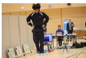
腰に測定器具を付けてジャンプ!