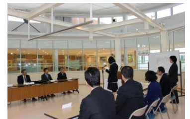
贈呈式でお礼の言葉を述べる生徒

広島東南ロータリークラブ様から医療的ケア室で使用する吸入器1台、吸引器2台、パルスオキシメータ3台を、株式会社シンギ様から音楽教室2と3にアンプ、レコーダー、プロジェクター、100インチスクリーンの音響設備各1式、サポートセンターで教材や資料を製作するスキャナ1台を御寄贈いただき、それぞれ10月30日(月)と11月24日(金)に贈呈式を行いました。贈呈式の中で生徒会会長や副会長が本校児童生徒を代表してお礼の言葉を述べたり、実際に有効活用させていただいている授業の見学や作業学習で作製したクッキーやパン、コーヒーサービス等を行ったりして感謝の気持ちを表しました。貴重な物品を御寄贈いただいた上に、お忙しい中贈呈式に出席くださり、児童生徒の日頃の学習の成果を発表できる場を御提供いただいた広島東南ロータリークラブの皆様、株式会社シンギの皆様、心より感謝申し上げます。