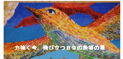
力強く今、飛び立つ89の希望の星