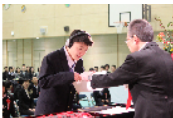
中学部で着る新しい制服で 卒業証書を受け取る小学部卒業生

楽しく、うれしく、面白かった思い出は、自分を励まし、生きる元気と自信を育ててくれます。つらい、苦しかった思い出も、受け止め乗り越えることによって自分を強くし、心を広くしてくれます。いろいろな思い出は、みなさんの心の中で生き続け、中学部、高等部に進学しても大きな勇気を与えてくれるはず。卒業生の頑張りに、会場の方々の卒業生をお祝いする気持ちが一つになった温かい卒業証書授与式となりました。ありがとうございました。小学部卒業生16名、中学部卒業生34名の皆さんの幸せと活躍を心からお祈りしています。