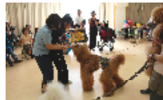
ワンちゃんと触れ合う生徒(中3)