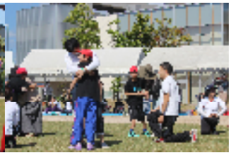
ふたりはなかよし(親子演技)