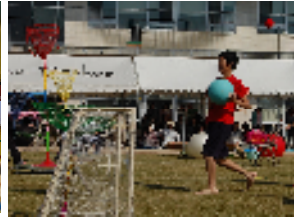
ゴールをねらう生徒