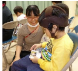
歯科検診の手順を写真カードで確認