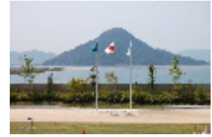
多目的ホール2から望む似島