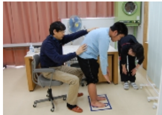
整形外科検診をしてくださる福原学校医