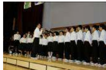
文化祭舞台発表 瀬戸内合唱団

ホームページ : http://www.hiroshimayogo.edu.city.hiroshima.jp/