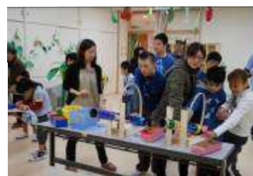
ジャングルポッケ 中学部2年生