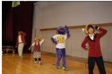
文化祭といえば 恐竜君 恐竜君と一緒に恐竜サンパを踊りました