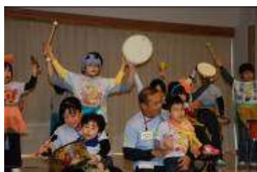
にぎにぎ にぎやか カーニバル 小学部2年生