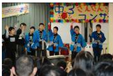
中3 さんさんコンサート 中学部3年生