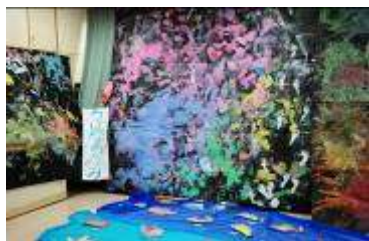
うじなのうみ 小学部4年生