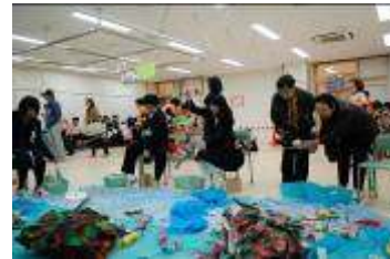
つろうや中1 中学部1年生