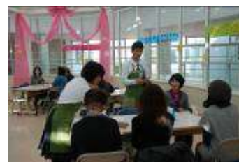
高1 にこにこ「ふれ愛カフェ」 「いらっしゃいませ！」