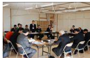
岡山市議会文教委員会の皆様に、学校概要について説明しました