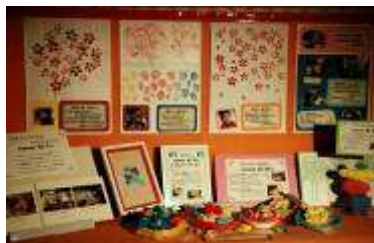
訪問ミュージアム 訪問学級

さて、今年の文化祭、皆様はどのような御感想をおもになられたでしょうか。私は、作品展示や模擬店、ステージ発表のいずれも日頃の学習の成果と工夫が観られ、大変うれしく思いました。とりわけ高等部においては、各作業学習で製作した製品の質が更に高まっていると感じました。また、生徒一人一人がおもてなしの心をもって、大変気持ちの良い接客態度で臨んでいたとの印象をもちました。今後、より一層活動内容の充実を図るとともに、広報活動も工夫しながら、より多くの方々に来校いただけるよう努めてまいります。