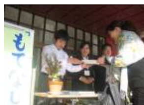
おもてなしの心で 「いらっしゃいませ！」