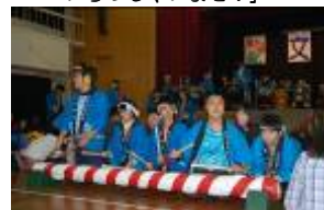
はらっぱだいこ 中学部3年