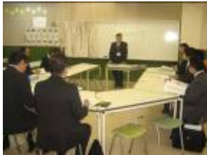
気合を入れて挨拶をしました

11月17日(木)、制服取扱業者3社に本校に集まっていただき、制服制定説明会を行いました。制服を制定する旨は既に保護者の皆様にお知らせしておりますが、この度の説明会では、業者選定を行う方法や本校が考える制服のコンセプト、基本的事項(例えば、上着は濃紺色でブレザータイプ等)について、業者に対して説明をさせていただきました。今後、業者には予定価格を含めた提案書を提出していただき、12月22日(木)には、3社によるプレゼンテーションを実施し、選定判断基準に基づいた厳正な審査を行い、取扱業者を決定する予定です。年が明けて1月下旬には、新しい制服を皆様に披露できるよう、準備を進めてまいります。