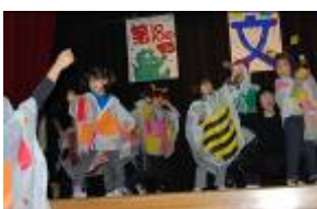
むしむし3パで カーニバル 小学部3年