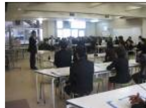
校長講話を真剣に聴く初任者の先生方