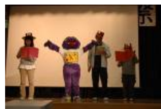
文化祭といえば 恐竜君 「文化祭が始まるよ」