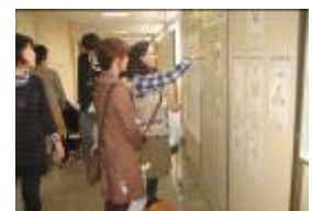
校章応募作品展 新校章決定！