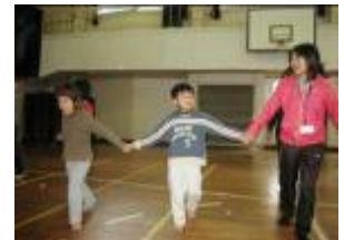
小学部1年生と一緒に