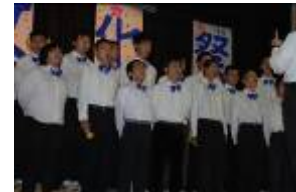
天使のハーモニー 高等部3年5・6・7・8組