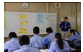
真剣に指導を受ける生徒たち