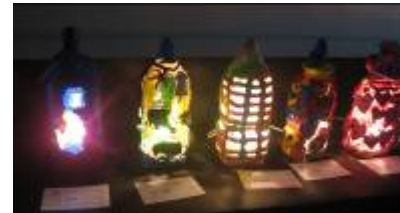
高2「紙粘土で明かりを楽しもう」 ペットボトルが大変身！

ホームページ : http://www.hiroshimayogo.edu.city.hiroshima.jp/